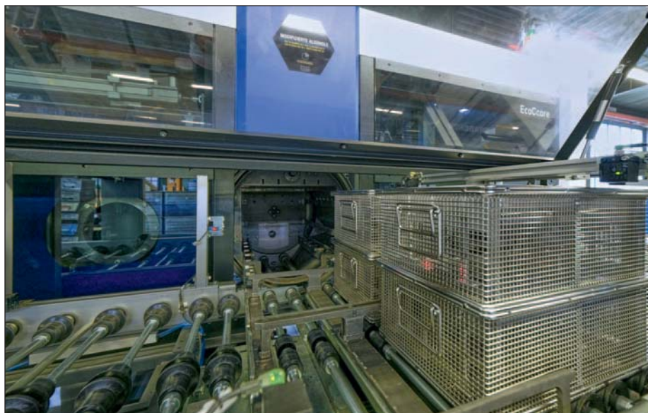
Bis zu einer halben Million Drosselklappen fahren pro Woche durch die neue Entfettungsanlage bei Springfix.

Die Springfix AG steht für moderne Umformtechnik und spanabhebende Weiterverarbeitung in der Mittel- und Grossserienproduktion. Das Unternehmen beliefert weltweit Automobilzulieferer, Gebäudesattler und die Elektroindustrie. Vom Engineering und der Konstruktion über den hauseigenen Werkzeugbau, die Fertigung bis hin zu Logistik und Service bekommen die Kunden alles aus einer Hand. Das Leistungsangebot umfasst Normalstanzen von 200 bis 4000 kN Presskraft, Know-how im Biegen und Ziehen, die Verarbeitung von lackierten, galvanisierten oder gebürsteten Bandoberflächen sowie spanabhebende und oberflächenbehandelnde Folgearbeitsgänge. Ein breites Werkstoffspektrum von Stahl, Aluminium über rostfreie Stähle bis hin zu Kupferlegierungen und Messing runden das Portfolio ab. Am Firmensitz beschäftigt das Unternehmen rund 50 Mitarbeiter.