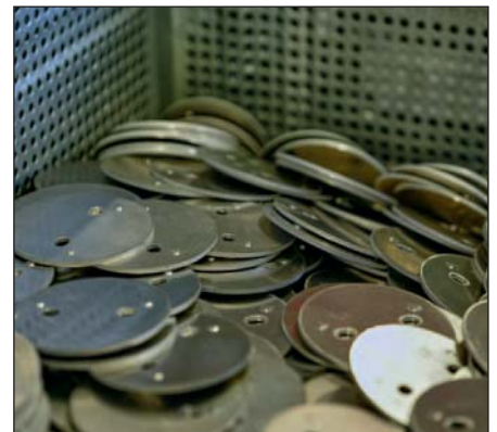
Die Drosselklappen kommen unter anderen im Ansaugtrakt der Verbrennungsmotoren bei den unterschiedlichsten Autoherstellern weltweit zum Einsatz.

Ende Dezember 2018 kam die neue Anlage «EcoCore» von Ecoclean, die an nur einem halben Tag installiert wurde. «Wir konnten die Anlagen nicht parallel