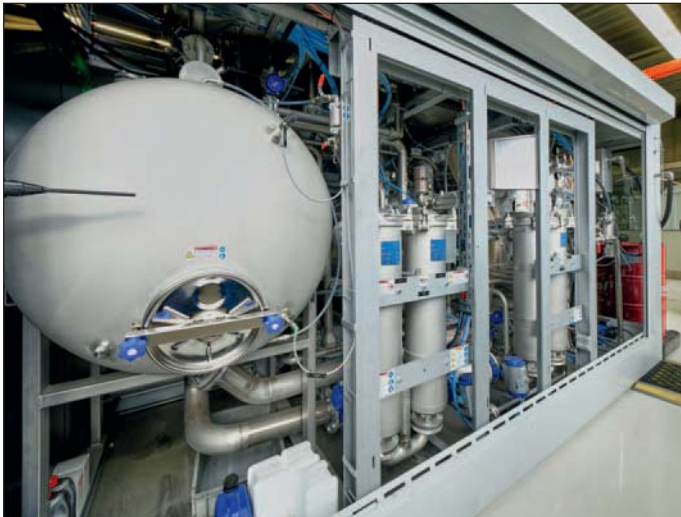
Die Lösemittel tanks befinden sich auf der Rückseite der Reinigungsanlage «EcoCore» von Ecoclean.